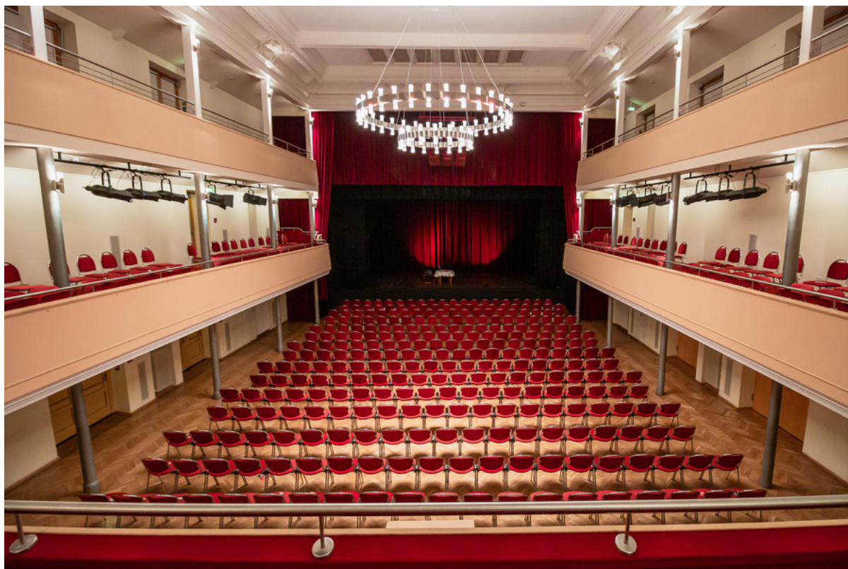
Kulturhaus der Stadt Weißenfels